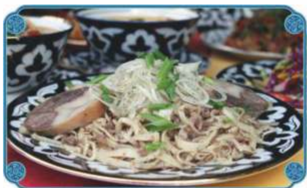
“НАРЫН” ..... 1900 Мелко рубленное тесто и мясо конины со специями