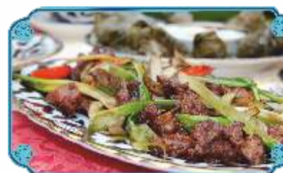
ФИЛЕ ЯГНЁНКА С ОВОЩАМИ ..... 1700 кусочки ягненка, обжаренные с овощами и со специями в восточном стиле