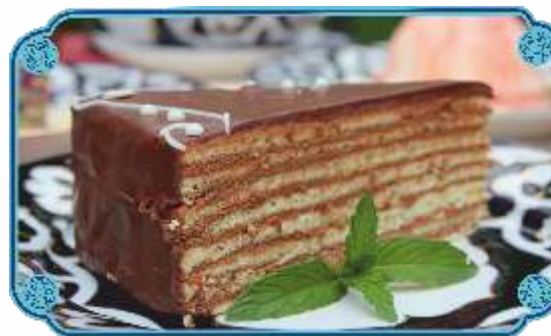
ШОКОЛАДНЫЙ ТОРТ "КАПРИЗ" .....1600 нежный бисквит с шоколадным кремом