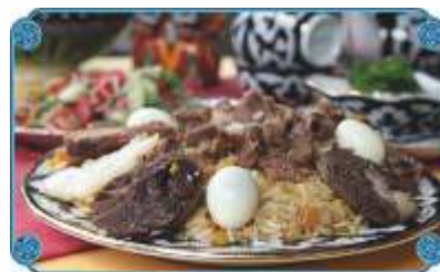
ПЛОВ "ТОЙ ОШИ" ..... 1950 Свадебный плов с бараниной, желтой морковью, белым изюмом и горохом "Нохат "