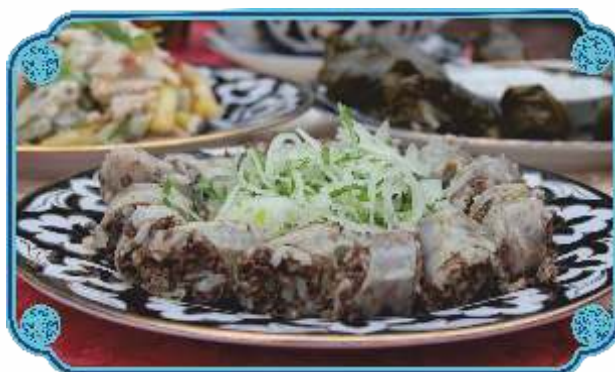
ХАСЫП ..... 1900 Домашние колбаски с ливером, мясом и рисом