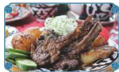
КАЗАН КАБОБ ..... 2800 Ребрышки молодого барашка, обжаренные в казане с золотистым картофелем со специями