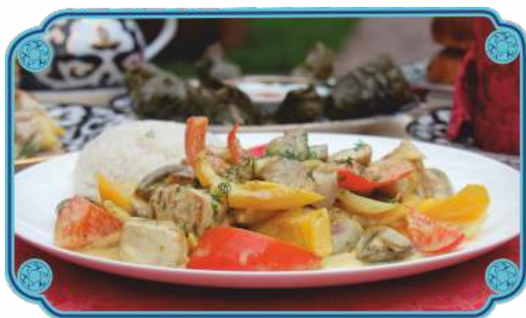
КУРИНАЯ ГРУДКА С СОУСОМ КАРРИ .....1700 Куриное филе со сладким перцем, и шампиньонами