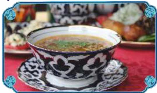
МАМПАР .....950 Восточный суп с клецками