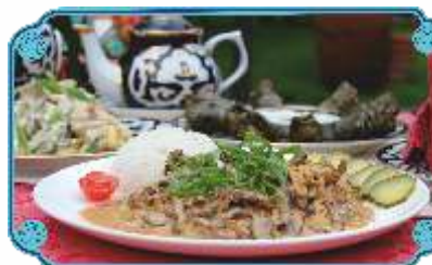
БЕФСТРОГАНОВ ..... 2600