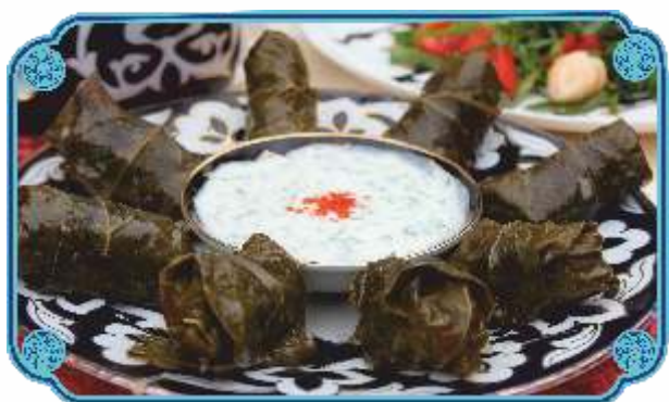
ДОЛМА ..... 2100 Мелко рубленное филе барашка с рисом и со специями