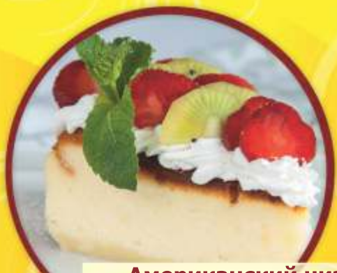
Американский чизкейк (запеченный сырный десерт на основе сыра филадельфия)