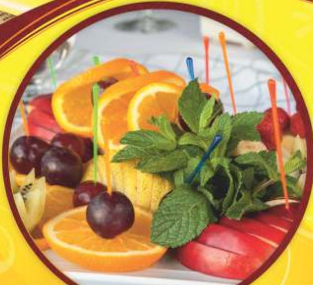
Фруктовая ладья 3890 г