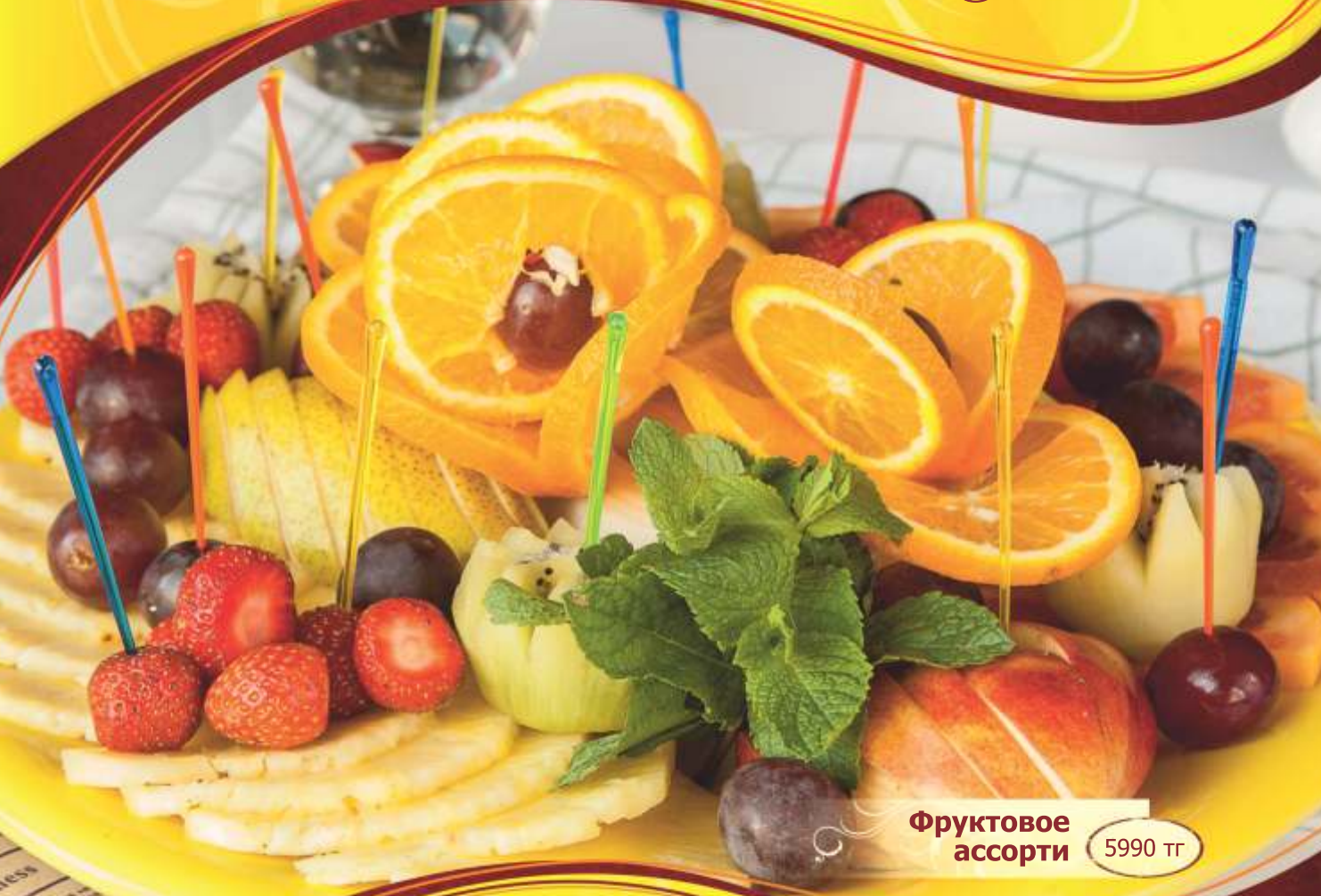
Фруктовое ассорти 5990 г