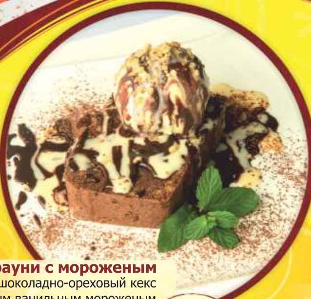
Брауни с мороженым (горячий шоколадно-ореховый кекс с нежным ванильным мороженым и шоколадным соусом)