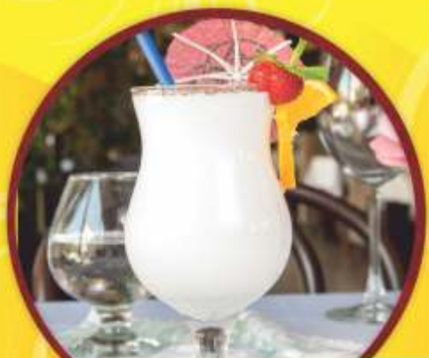
Молочный коктейль с мороженым на Ваш вкус 1390 г