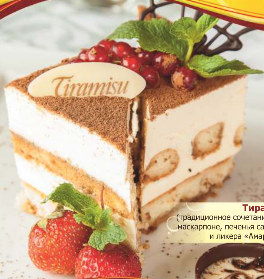
Тирамису (традиционное сочетание сыра маскарпоне, печенье савоярди и ликера «Амаретто»)