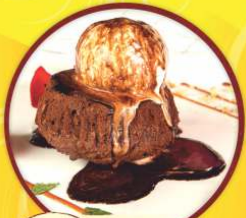
1290 тг Фондан