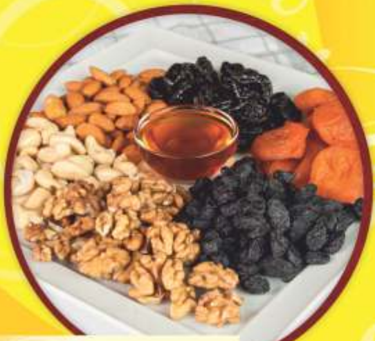
Сладости к чаю 2590 г